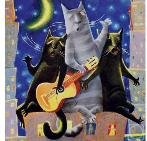
В марте ночные кошачьи "концерты" никому не дают покоя

Природные расчеты настолько точны, что нам остается только удивляться! Начало весны, без всякого сомнения, ознаменовано первыми похождениями усатых «ловеласов» – мартовских котов.